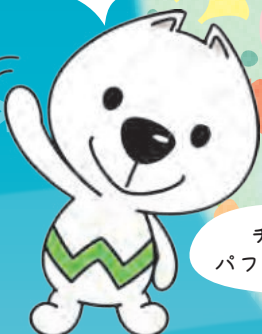
和歌山県 PR キャラクター きいちゃん