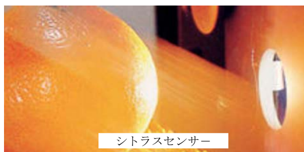
シトラスセンサー

以来本所は一貫して、発明の奨励普及、創造性育成、優れた発明家に対する援助と指導や相談、科学技術振興団体への助成等の事業を推進するとともに、県内産業に役立つ工業技術の開発を支援してきましたが、現在はこれらの事業を「技術・開発」「食品化学」「振興事業」の三部門に分けて実施しています。