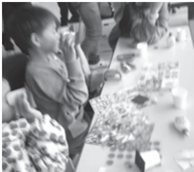
光の正体を見つけよう体験

エネルギー差発電をはじめ、ペットボトルを用いた竜巻づくりや雲づくり、クイズの4種類の体験を用意。そして新しいものとして「光の正体を見つけよう」を導入。太陽光や照明灯の白っぽい光は、どうして七色に変化するのか、分光シートを用いてその謎を見つけてもらいました。また、