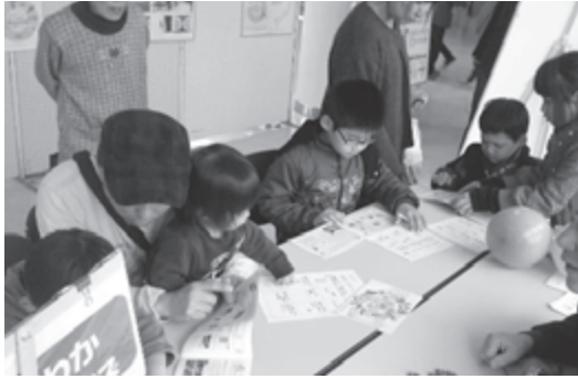
えこわかビンゴクイズ体験

今年も岩出市総合保健福祉センターで開催された岩出市民ふれあいまつりに「親子で体験する環境教育」をテーマに5種類の体験教室を出展しました。おなじみとなった熱